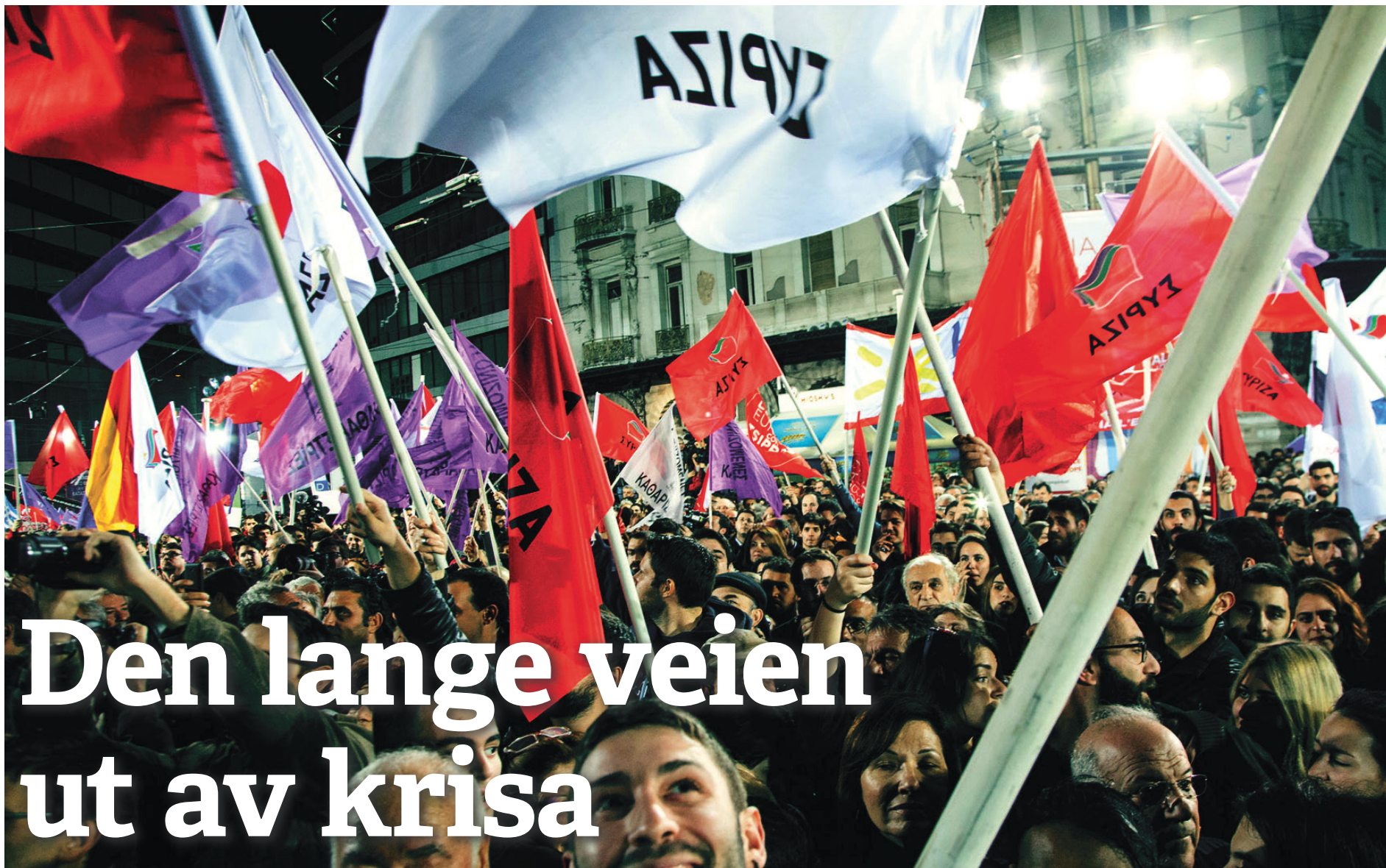
Valgseier: Rødts greske samarbeidspartner Syriza gjorde et brakvalg i januar.