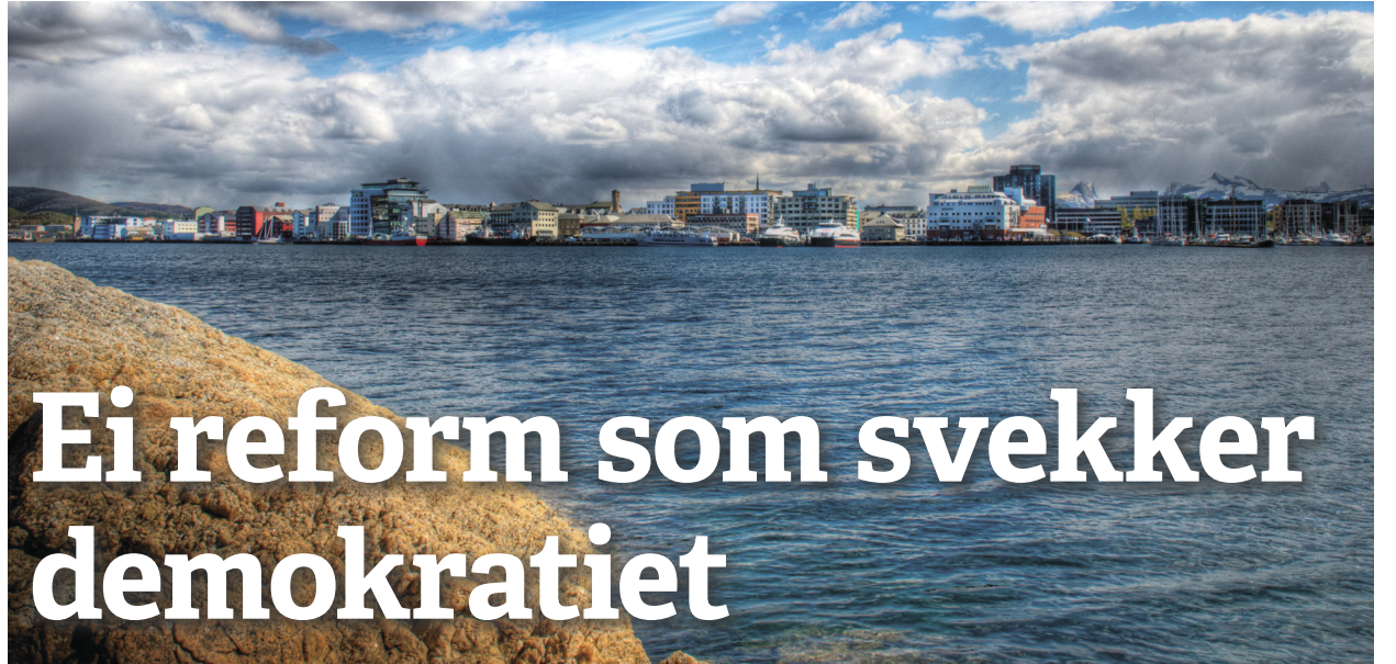
Nordland: Forslaget om nye storkommunar trugar retten til innflytelse i eige lokalmiljø.