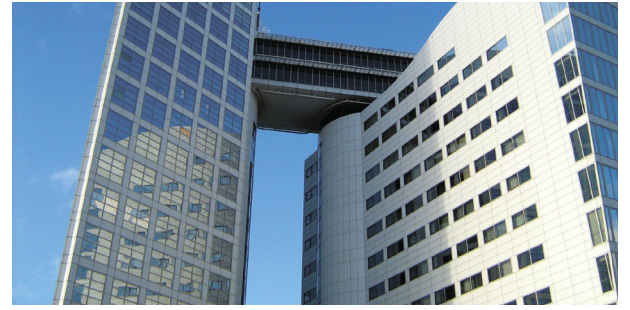
Haag: Den internasjonale straffedomstolen.