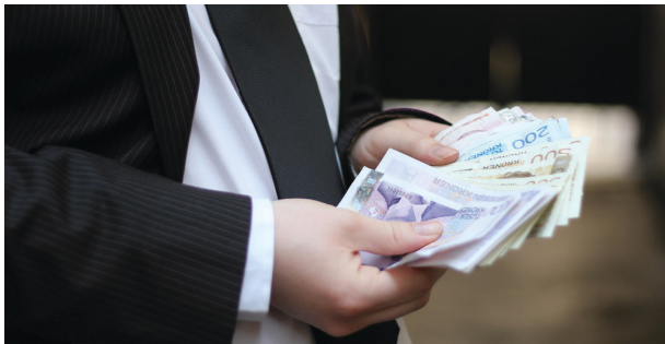
Tjener fett: Norske ledere.