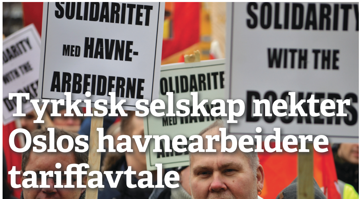
Kjemper for tariffavtale: Bryggesjauerne ved Oslo Havn.

Både IMF og OECD vedgår nå at ulikhet er et politisk problem, som svekker veksten og øker risikoen for økonomiske kriser. Høyresidens utdaterte myter, der omfordeling er skadelig for økonomien, og fagbevegelsens fellesløsninger står for noe gammeldags, stivt og uodynamisk, står åpenbart for fall.