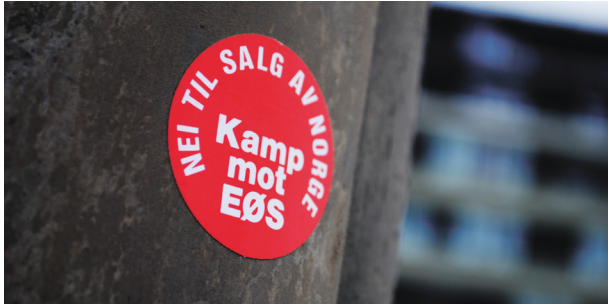
Upopulær: EØS-avtalen.