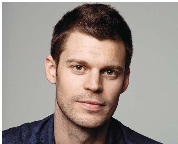
Rødt-leder: Bjørnar Moxnes.

– På dette punktet har KrF og Venstre gitt seg i tidligere forhandlinger med regjeringa, og i stedet godtatt at det skal tas «større hensyn» til barns behov. I denne runden har de gitt Frp gjennomslag for ytterligere innstramming, blant annet strengere regler for familiegjenforening. I sum betyr dette at Norge fortsatt vil føre en inhuman asylpolitikk overfor mange barn som flykter fra krig og nød.