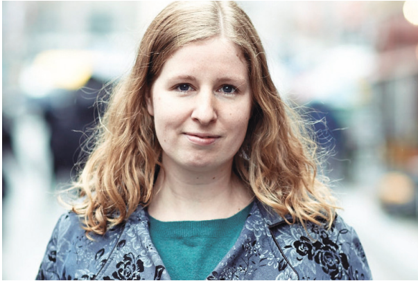
Miljøpolitisk talsperson: Elin Volder Rutle.