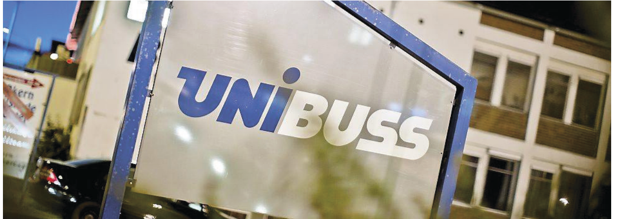
Korrupsjonsutsatt: Unibuss er det største av Oslos Sporveiers datterselskap.