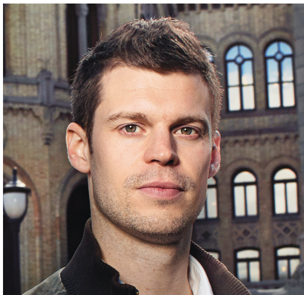
Rødt-leder: Bjørnar Moxnes.