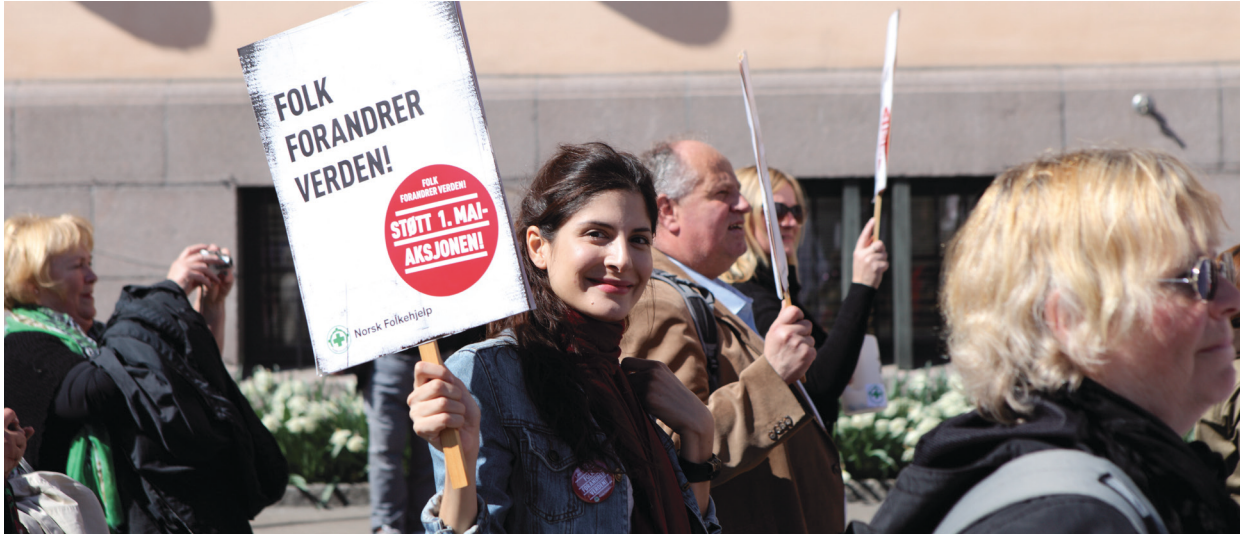
Folk forandrer verden: Hvert år samler Norsk Folkehjelp inn penger 1. mai.