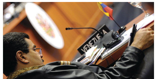
Under press: President Nicolás Maduro.